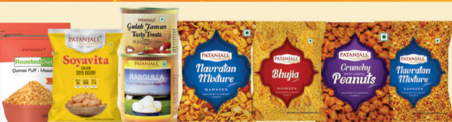
स्वीट्स एवं स्नैक्स