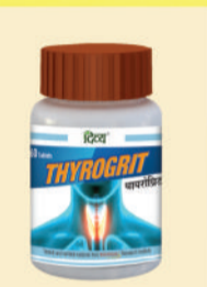
थायरॉइड के लिए

चिकित्सा के परामर्श के लिए अपने नजदीकी पतंजलि चिकित्सालय पर अवश्य विजिट करें।