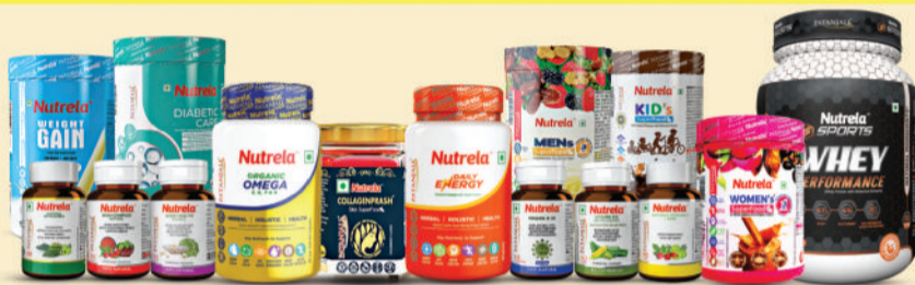
वहिष्कार करें- केमिकल व एनिमल बेस्ड प्रोडक्ट्स का और न्यूट्रला नैचुरल ऑर्गेनिक प्रोटीन, विटामिन्स, ओमेगा आदि अपनाएं