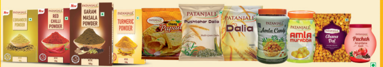
पतंजलि मसाले, पापड़, दलिया, कैंडी, मुरब्बा, नमकीन और पाचक

भारत एक ऋषि एवं कृषि प्रधान देश है। इसलिए उच्चतम श्रेणी के पशु आहार एवं फूड सप्लीमेंट्स।