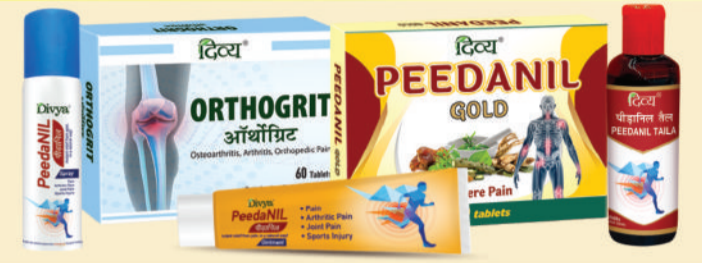
वात रोग, आर्थराइटिस, RA, CRP, AVN, ANA, HLA-B27 आदि के लिए