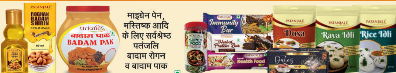
माइग्रेन पेन, मस्तिष्क आदि के लिए सर्वश्रेष्ठ पतंजलि बादाम रोगन व बादाम पाक, एनर्जी बार एवं इंस्टेंट मिक्स