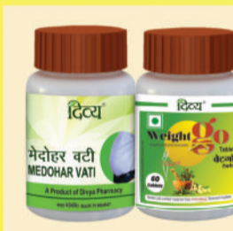
ओबेसिटी के लिए अचूक औषधि