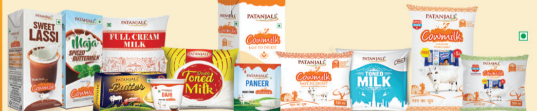
दिल्ली एनसीआर, उत्तराखण्ड, राजस्थान व महाराष्ट्र में पतंजलि के डेयरी प्रोडक्ट्स उपलब्ध हैं।

नोट- पतंजलि के मल्टीग्रेन आटा व कुछ विशिष्ट 1 हजार प्रोडक्ट्स पतंजलि एक्सक्लूसिव स्टोर्स पर ही उपलब्ध हैं।