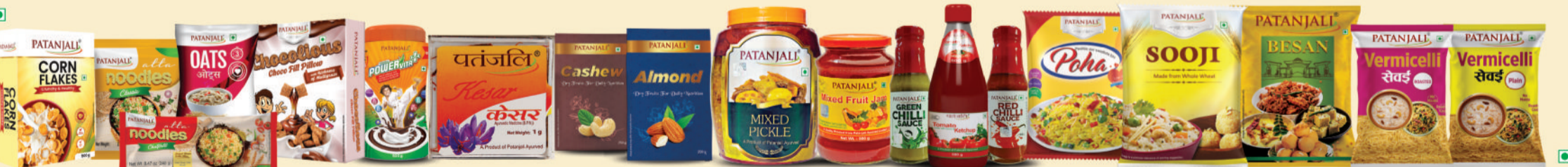
पतंजलि हेल्दी एवं न्यूट्रिशियस फूड प्रोडक्ट्स, पावर वीट, केसर व ड्राईफ्रूट्स, अचार, जैम व सॉस, पोहा, सूजी, बेसन, सेवई