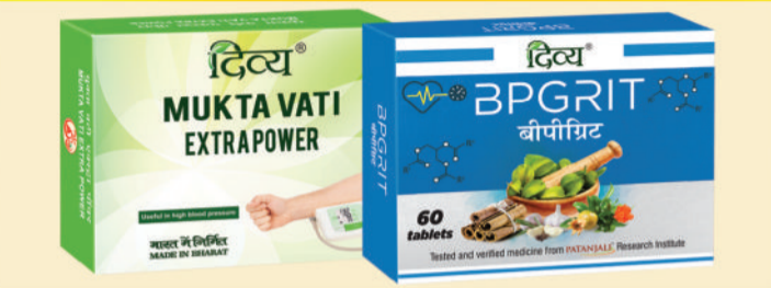
हाई बी. पी. को प्राकृतिक रूप से निर्मूल करने के लिए।

अर्थ से परमार्थ व राष्ट्रसेवा (Prosperity for Charity): PFL को प्राप्त होने वाला सम्पूर्ण लाभ, पतंजलि गुरुकुलम्, भारतीय शिक्षा बोर्ड, आचार्यकुलम्, पतंजलि विश्वविद्यालय, रिसर्च फाउंडेशन, चिकित्सा, शिक्षा, वृक्षारोपण, सनातन धर्म और भारत माता की सेवा में पूर्णतः समर्पित किया जाता है। इस प्रकार लाभ का 100% भाग निःस्वार्थ चैरिटी और राष्ट्रसेवा के कार्यों में लगाया जाता है। पूजनीय स्वामी रामदेव जी का संकल्प है कि अपने अंतिम श्वास तक हम पवित्रता और प्रामाणिकता के साथ भारत माता की सेवा करते रहेंगे तथा एक स्वस्थ, समृद्ध और परम वैभवशाली भारत के निर्माण में अपना योगदान देते रहेंगे। पूजनीय आचार्य बालकृष्ण जी कई वर्षों से विश्व के शीर्ष 2% वैज्ञानिकों और अनुसंधानविदों की श्रेणी में सम्मिलित हैं। उनके दृष्टिकोण से पतंजलि विज्ञान, अनुसंधान और स्वदेशी नवाचार के माध्यम से वैश्विक मानचित्र पर अग्रणी ब्रांड बन रहा है। योग, आयुर्वेद, स्वदेशी, सनातन धर्म की सेवा में आज पतंजलि भारत के श्रेष्ठतम संस्थान के रूप में कार्यरत है।