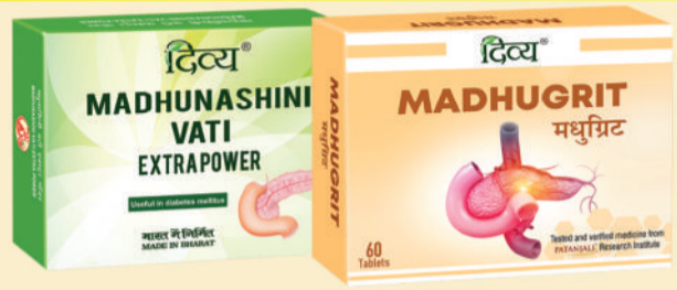
डायबिटीज को रिवर्स करने में लाभदायक