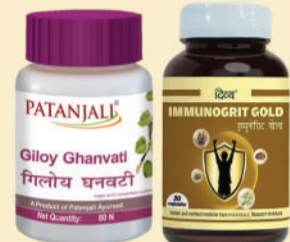
इम्यूनिटी के लिए सर्वश्रेष्ठ औषधियाँ