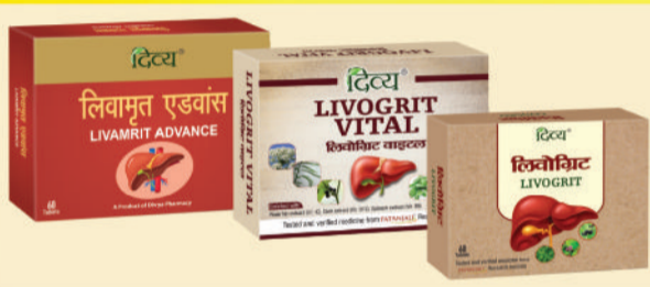
फैटी लिवर, लिवर सिरोसिस, हेपेटाइटिस आदि को रिवर्स करने के लिए