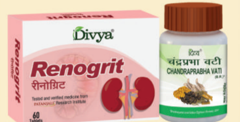
किडनी प्रॉब्लम्स को रिवर्स करने के लिए