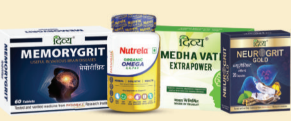
ब्रेन, नर्वस सिस्टम व मेमोरी के लिए सर्वश्रेष्ठ औषधियाँ