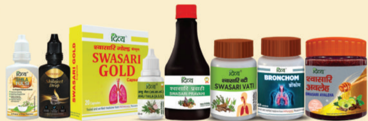
ब्रोंकाइटिस, अस्थमा, कफ, कोल्ड के लिए रिसर्च एवं एविडेन्स बेस्ड मेडिसिन