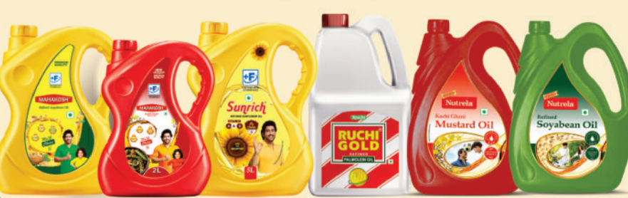
महाकोश, सनरिच, रुची गोल्ड देश का नं. 1 पाल्म ऑयल ब्रांड एवं न्यूट्रला ऑयल रेंज