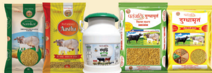
पतंजलि पशु आहार

लगभग 1 करोड़ स्टोर्स पर पतंजलि के प्रोडक्ट्स उपलब्ध हैं। फिर भी कोई प्रोडक्ट स्टोर पर उपलब्ध नहीं है तो आप दुकानदार से इसकी डिमाण्ड करें, वो इसे उपलब्ध करायेंगे।