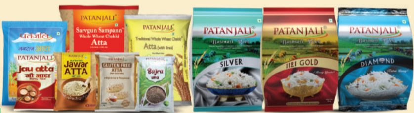
पतंजलि के आटा रेंज एवं पतंजलि चावल रेंज

नोट- पतंजलि के मल्टीग्रेन आटा व कुछ विशिष्ट 1 हजार प्रोडक्ट्स पतंजलि एक्सक्लूसिव स्टोर्स पर ही उपलब्ध हैं।