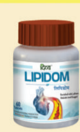
कोलेस्ट्रॉल के लिए