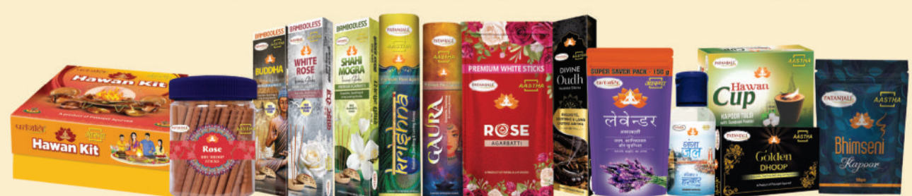
धूप-अगरबत्ती के नाम पर बहुत भयंकर मिलावट है तथा 100% पवित्रता बाँस रहित अगरबत्ती, भीमसेनी कपूर, शुद्धतम तिल तेल, हवन सामग्री आदि से अपने इष्ट का पूजन करें।