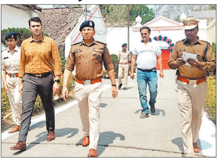
जिला जेल पहुंचे कलेक्टर-एसएसपी।

अधिकारियों ने विभिन्न बैचों का भ्रमण कर बंदियों से सीधे संवाद स्थापित किया। बंदियों की समस्याओं और सुझावों को गंभीरता से सुना गया। इस दौरान स्वास्थ्य सेवाओं की उपलब्धता, अधिवक्ता से मुलाकात की व्यवस्था तथा निःशुल्क कानूनी सहायता से जुड़े विषय अधिकारियों के समक्ष रखे गए। कलेक्टर एवं एसएसपी ने सभी बिंदुओं पर आवश्यक कार्यवाही सुनिश्चित करने का आश्वासन दिया। निरीक्षण के क्रम में पूर्व में आयोजित वृहद स्वास्थ्य शिविर की